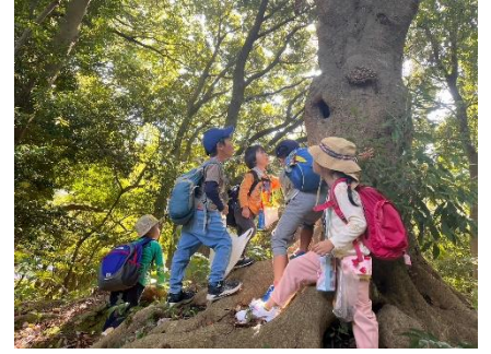
今年は年少児も含め六つの縦割りグループに分かれて、秋の園の遠足へ7