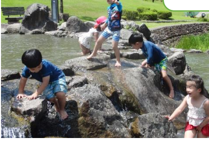
内川スポーツ広場で水遊び