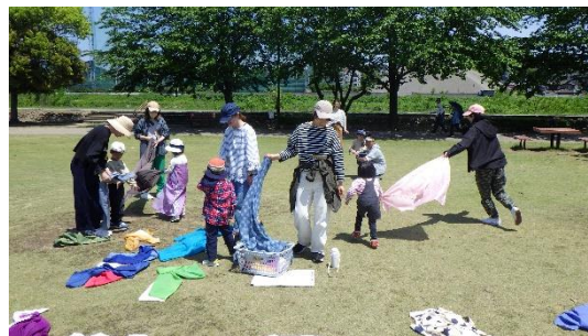
年中さんは、ぐるぐる公園へ