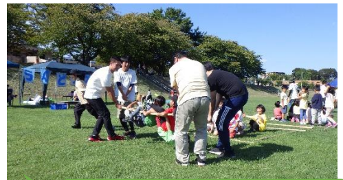
広い芝生で子どもも大人も思い切り体を動かしました！