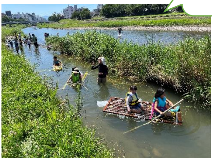
法島の犀川緑地で自然を満喫