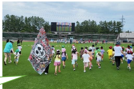
今年の木の花の園旗は『海賊』