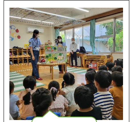
交通安全教室 年長児が参加