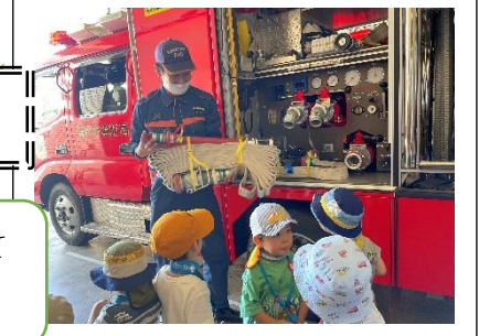
ふらっとバスに乗って 消防車見学