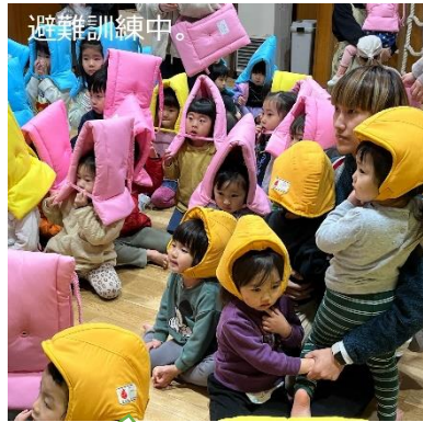
能登半島地震を受け、実際に防災頭巾をかぶっての訓練