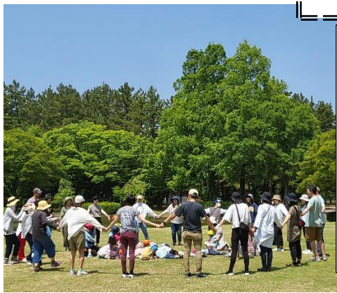
年少さんは、西部緑地公園