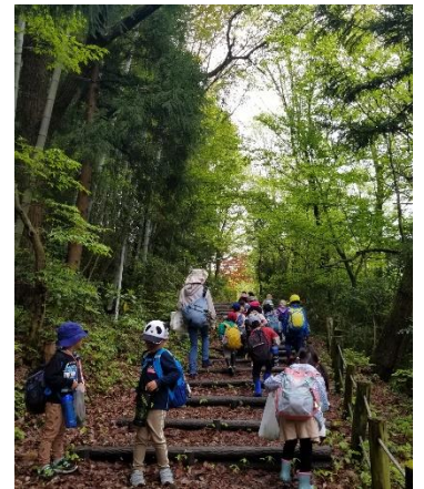
年長さんは、奥卯辰山へ